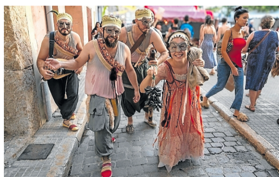
Un grup de participants.