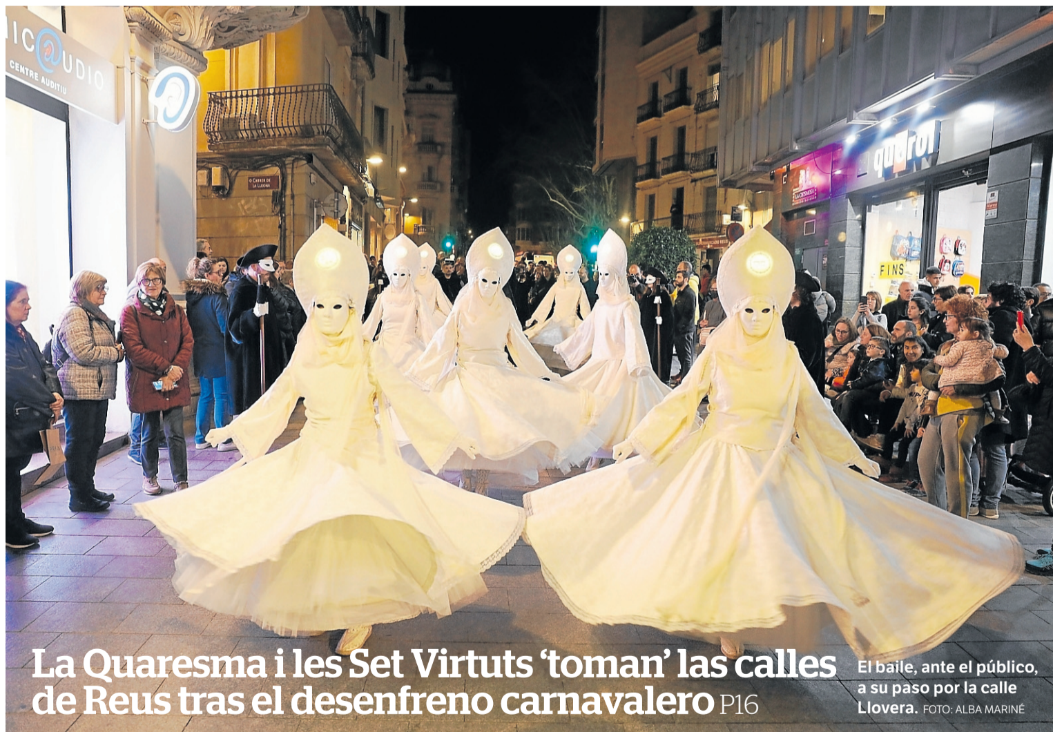
La Quaresma i les Set Virtuts 'toman' las calles de Reus tras el desenfreno carnavalero P16

Tarragona. Ayuntamiento y Generalitat actúan de forma subsidiaria ante el derrumbe de parte de la cubierta del emblemático edificio para garantizar su estabilidad y su valor patrimonial P9